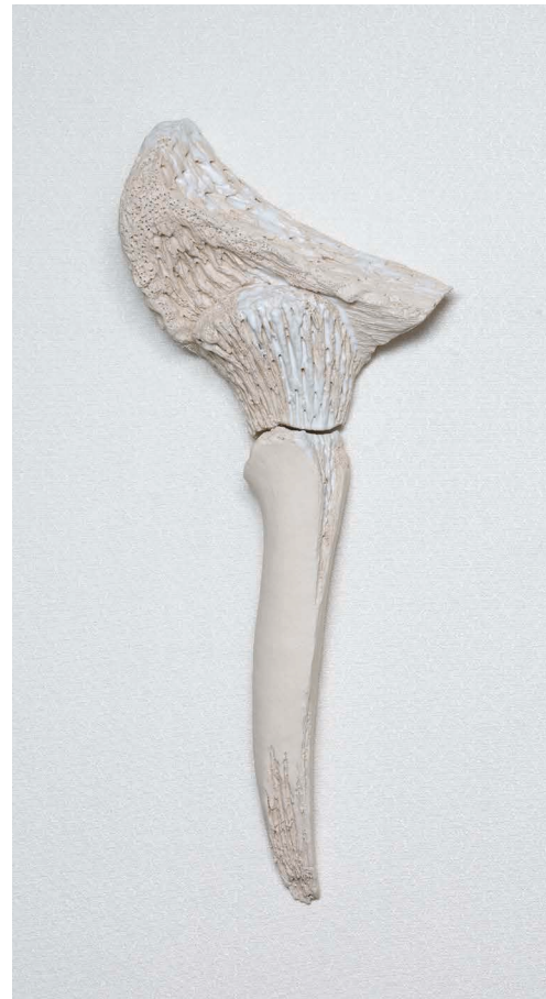
③ 根 陶土(瀬戸の土) H19.8×W16.2×D7.7 Root Pottery clay (from Seto)